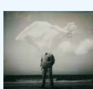
Corinne Mercadier, 'Soleil, les fils et les papiers', 2000. Corneille (Série "Une vez y no más" #10), 2000. Corneille Galerie Binome. © Corinne Mercadier, VEGAP, Madrid, 2025.

Over a hundred paintings by the Spanish artist (Valencia, 1944) offer an overview of her career.