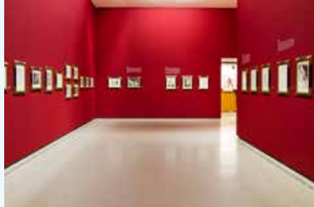
© Marcelo Villera, © Suceleón Pablo Picasso, VEGAP, Madrid, 2025.

Examining Madrid's bohemian world, from the mid-19th century to the 1920s.