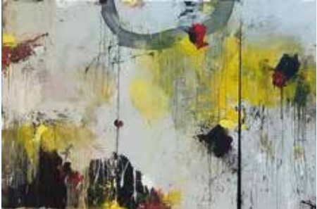
© Manolo Oyonarte, VEGAP, Madrid, 2025.

An exhibition on the work of the New York-based Argentine artist, which highlights her relationship with the notion of trace.