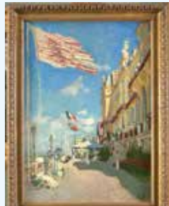
Claude Monet (Paris, 1840-Chermy, 1926), Hôtel des Roches Noires, Trouville, 1870. Paris, Musée D'Orsay, donación de M. Jacques Laroche, 1947.

A reflection on the success of Baroque polychrome sculpture and its close relationship with painting.