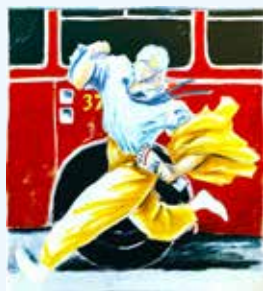
Fragmento del cartel 'Mitoscos, que era como', 1985. © Javier de Juan, VEGAP, Madrid, 2025.

A look at the traditions which live on in India today, through works by various artists from Belgium's Museum of Sacred Art Foundation.