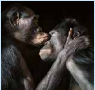
Borobos Kss. © Tim Flach.

This retrospective highlights the various languages of the artist and designer, among which drawing features as the overarching discipline.