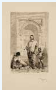
Mariano Fortuny Marañel, 'Enfilar', marzo/abr, 1983. Calcografía Nacional, Fotograf.

The artist from Lisbon, known for her installations, will show her work in the rooms and gardens of the palace.