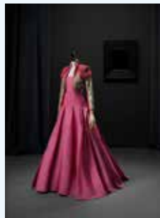
Lorenzo Caprile, Vestido de noche de S.A.R. la Infanta Dña Elena para la boda de S.A.R. Victoria de Suecia y Daniel Westling, 2010.

This exhibition explores the notion of time and how it's represented. Annie Leibovitz's portraits of King Felipe VI and Queen Letizia are also featured.