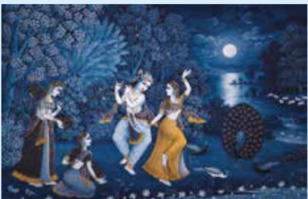
Fragmento del cartel 'Mitoscos, que era como', 1985. © Javier de Juan, VEGAP, Madrid, 2025.

An exhibition of sculptures and photographs relating to memory, the nature of objects and the aesthetic influence of industrial processes.