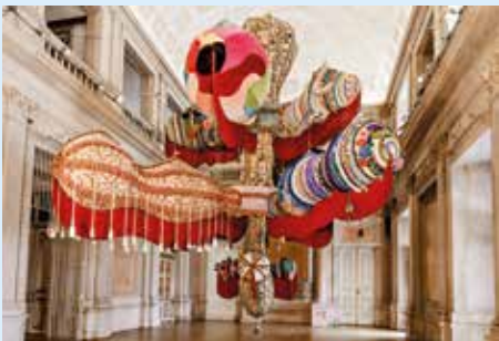
Royal Valleyre (2012), Joana Vasconcelos. © Luis Vasconcelos enise de la Rúa. © DMF, Lisboa / © Unidade Infrata-Projeccao, VEGAP, Madrid, 2025.

One of Spain's leading fashion photographers has enjoyed a career spanning over 50 years.