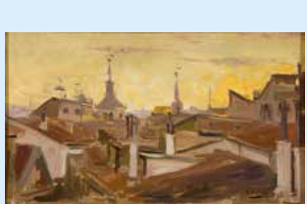
Teléfono de Madrid, Eduardo Chicharro (1899).

The lives of the Cerralbo and Villa-Huerta families.