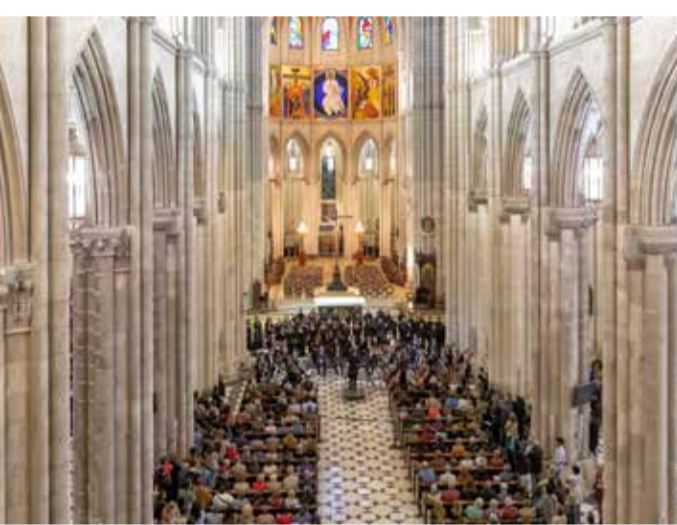
Interior de la Catedral de la Almudena

Durante vários séculos, Madrid fez parte da arquidiocese de Toledo. Após um longo período de construção, que começou no século XIX, João Paulo II consagrou a catedral em 1993. Uma cripta e um museu completam a visita. Diz-se que a imagem da Virgem da Almudena esteve escondida durante vários séculos na muralha árabe que rodeava a cidade. Atualmente, a imagem preside a um altar emoldurado por um retábulo de dezoito painéis pintados por Juan de Borgoña no início do século XVI.