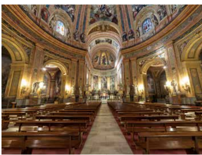
Interior de la Basílica de San Francisco el Grande

Construída no século XVIII, destaca-se pela sua impressionante cúpula de 33 metros de diâmetro, uma das maiores do mundo. Alberga valiosas obras de arte, incluindo pinturas de Zurbarán, Alonso Cano e Goya, que pintou um autorretrato no quadro São Bernardino de Siena pregando diante de Afonso V de Aragão .