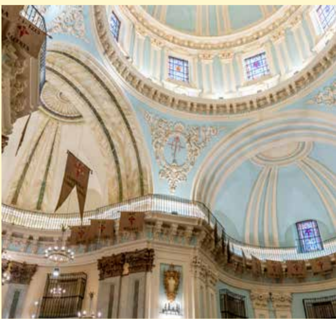
Interior del Monasterio de las Comendadoras de Santiago

The church is adorned with striking banners, serving as a reminder of the order's military origins. The visit includes access to other areas of this centuries-old institution, which was originally established to educate the daughters of the Knights of Santiago.