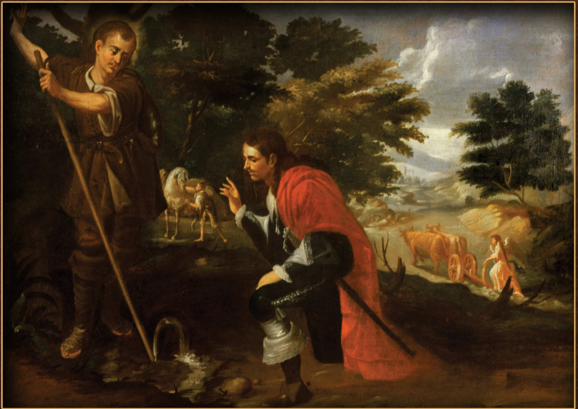
San Isidro Labrador y el milagro de la fuente. Óleo sobre lienzo. Anónimo. Hacia 1665-1675. Museo de San Isidro. Los Orígenes de Madrid

El Instituto de Estudios Madrileños, en colaboración con el Museo de San Isidro, integrado en el Área de Gobierno de Cultura, Turismo y Deportes del Ayuntamiento de Madrid, va a llevar a cabo un ciclo de conferencias para conmemorar el IV Centenario de la Canonización de San Isidro. El objetivo es dar a conocer los hechos más relevantes en torno al Santo Patrón de Madrid. Serán pronunciadas en el salón de conferencias del Museo de San Isidro (Plaza de San Andrés, 2 - 28005 Madrid), a las 19 horas en los días señalados y también se emitirán por vía telemática desde el siguiente enlace de nuestro canal de YouTube: