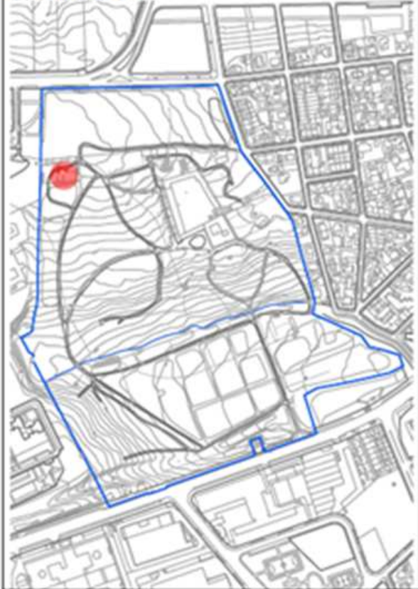
Ficha de Catálogo de Elemento singular: Noria Antigua